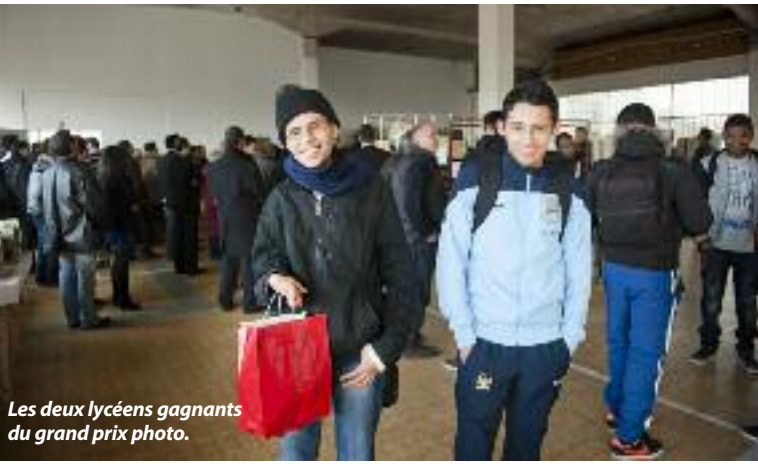
Les deux lycéens gagnants du grand prix photo.

senior, d'un jeune de la Mission locale et d'un membre de l'Artistorium. Quant au prix d'arts graphiques, il revient à Jean-Marie Robert pour son très beau collage intitulé Piano-bar, qui rend hommage aux savoir-faire des artisans d'art des Etains de Lyon. Jean-Luc Vessot, responsable du pôle animation de VVE, rappelle que de nombreuses œuvres sont mises gracieusement à disposition des entreprises de la commune par l'Artistorium pour qu'elles puissent décorer leurs locaux. M.K