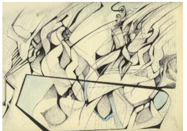
Ce dessin, intitulé Le miroir , a été offert par un patient du Vinatier à une soignante.

Centre de jour "Le fil d'Ariane", 15 rue Robert-Desnos. Tel : 04 37 45 10 20.