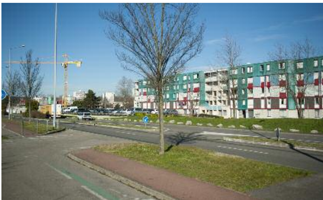
Les bâtiments chemins du Mont-Cindre et du Mont Gerbier seront démolis. A l'arrière plan, le chantier de construction de l'immeuble La Draissienne par Alliade habitat.

Le dernier conseil municipal de la mandature a entériné la création de la Zone d'aménagement concertée du Mas du Taureau, quatrième Zac en cours après celles de la Grappinière, de la Tase et de l'Hôtel de ville. Elle prévoit 2500 logements, des commerces, des équipements et des espaces publics.